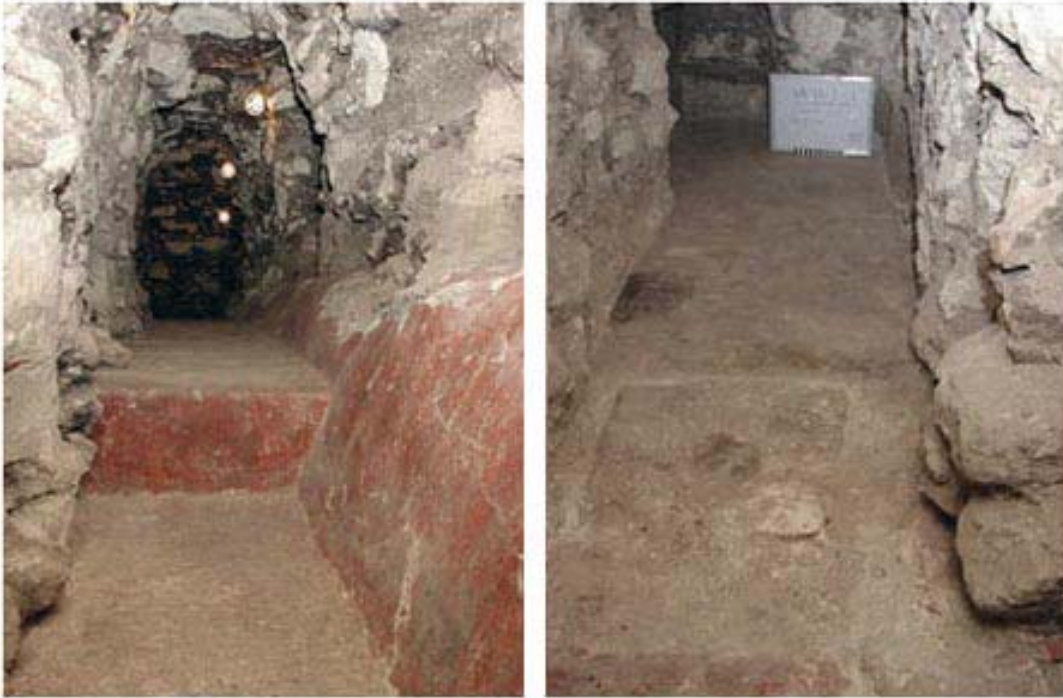
Figura 4. Excavaciones en Pinturas Sub-1, a la izquierda, terraza basal oriental y escalón axial de Sub-1, a la derecha, interior de Sub-1 mostrando la cicatriz del muro oriental destruido.

Uno de los objetivos de la temporada de campo 2002 era determinar las dimensiones generales de Pinturas Sub-1 y de los murales que contenía, a fin de planificar su futura excavación y conservación. Con este fin, nuestro equipo excavó un túnel ( Figura 4 ) a lo largo del muro oriental exterior de la estructura, lo cual reveló que el largo total de la plataforma basal de Pinturas Sub-1 era de 11 metros. Descubrimos que el muro oriental había sido destruido en tiempos antiguos, aunque buena parte de su mural se ha preservado en el relleno interior del recinto. En nuestras excavaciones se recuperaron numerosas porciones del mural que hemos podido reconstruir ( Figura 5 y Figura 6 ), entre ellas un glifo calendárico ( Figura 7 ) que formaba parte de una inscripción más larga, y que representa el ejemplo más temprano de escritura jeroglífica pintada de las tierras bajas mayas.