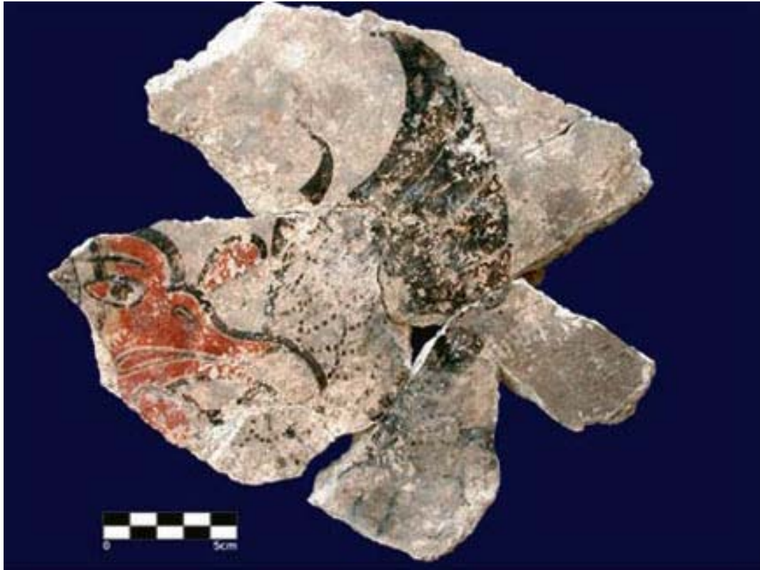
Figura 6. Segundo pájaro del caído Mural Oriental.