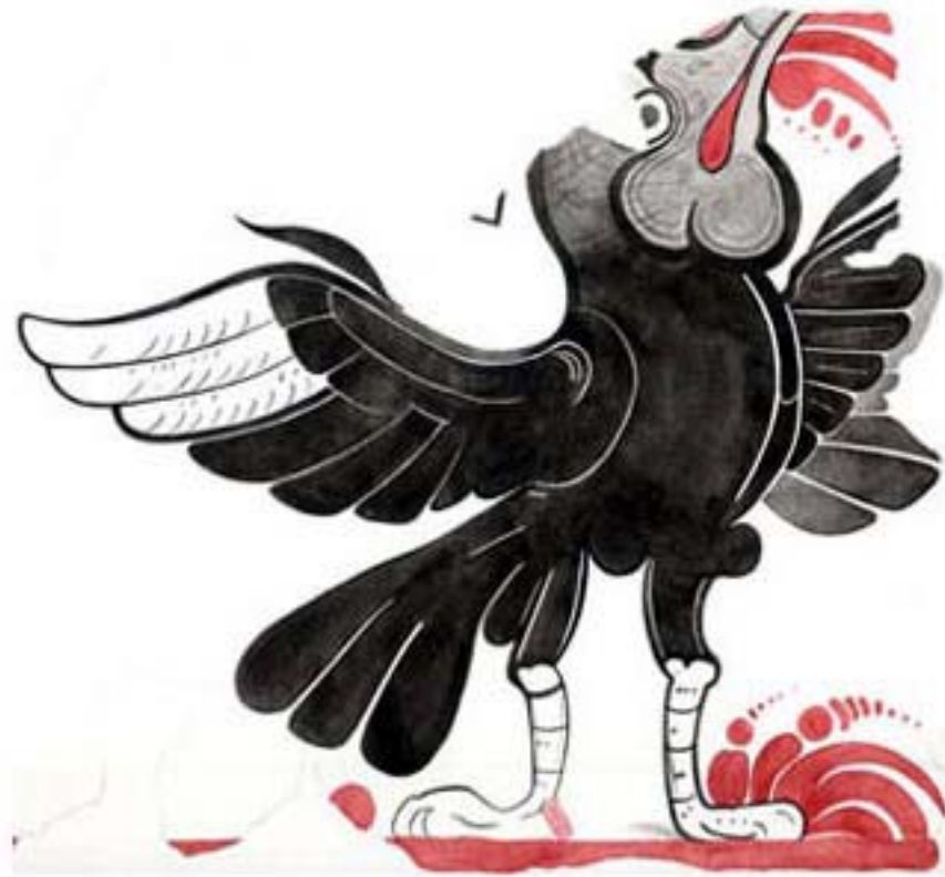
Figura 5. Reproducción medida en acuarela del pájaro del caído Mural Oriental, dibujo de Heather Hurst, 2002.