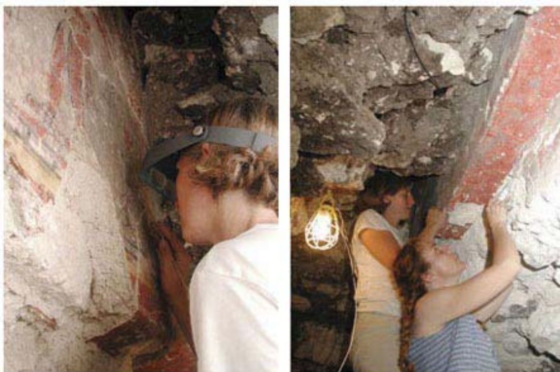
Figura 3. Actividades de conservación, a la izquierda, remoción de adherencias en la superficie, a la derecha, refuerzo de los bordes.

saqueadores retiraron la mitad inferior del muro norte de Pinturas Sub-1 en el proceso de cavar sus túneles. Las pinturas se encuentran en la mitad superior del mismo muro, que ahora cuelga suspendido en el aire por el relleno densamente compactado que lo rodea. La gravedad sin duda está haciendo lo suyo, porque las superficies están rajadas y hay trozos que se están comenzando a desprender. La conservación y el análisis del mural expuesto ha sido hasta este momento de primordial importancia para el proyecto ( Figura 3 ). Con este fin, desde el inicio mismo de las investigaciones en el sitio se contó con la colaboración de un equipo de conservadores. Al día de hoy, los murales han sido dibujados y fotografiados y se los ha limpiado de todas las adherencias biológicas que se encontraban en su superficie. Además, nos hemos servido de la fotografía digital de espectro múltiple para registrar las pinturas en su totalidad, tanto en sus espectros visibles como en los no visibles. El análisis químico y físico de los enlucidos y pigmentos está en curso, al igual que el registro de los datos de microclima del interior y del exterior del recinto del mural. Los frágiles bordes del mural han sido reforzados con yeso calizo y los fragmentos desprendidos fueron adheridos una vez más a su substrato. También hemos construido un poste provisorio y un soporte del dintel para reemplazar el muro faltante, con lo cual disminuye el peligro de un derrumbe catastrófico.