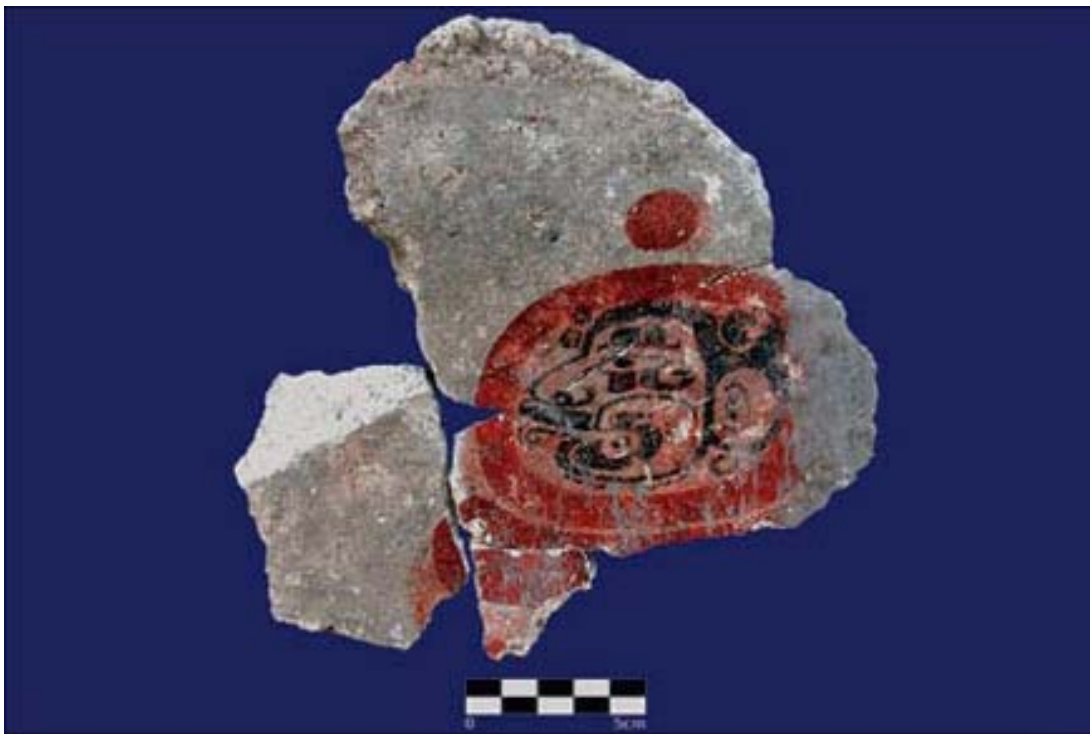
Figura 7. Glifo calendárico reconstruído del caído Mural Oriental.