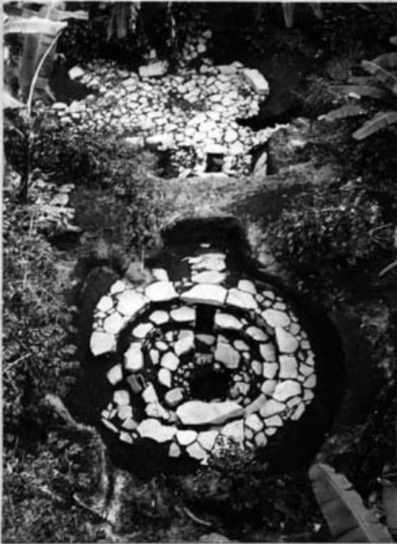
47-9-47a - Round structure from above, looking S.S.W. - showing underground passage, and flagstone paved terrace.

Fábrica 'El Paraíso,' Quetz. - La Bruta.