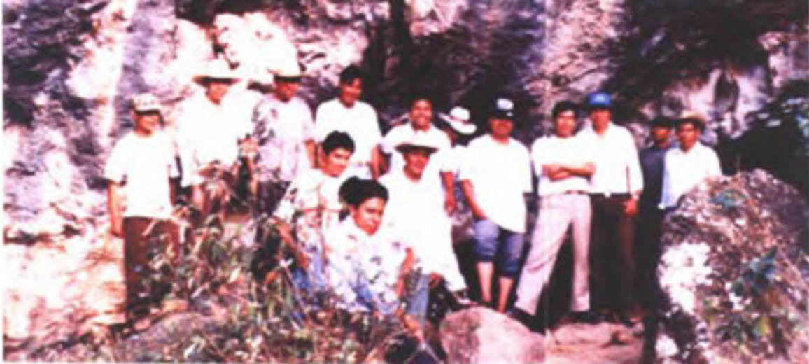
Figura 8. Los hombres del pueblo que me condujeron a las cuevas (Marzo de 1999)