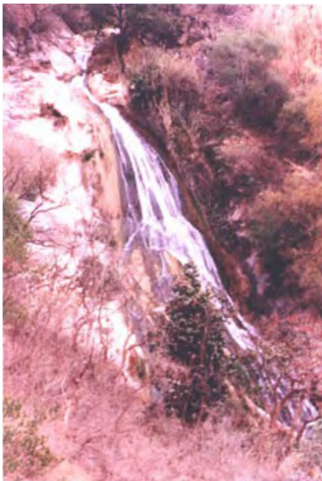
Figura 9. Cascada formada por el arroyo de la Cueva de Agua (Marzo de 1999)

cascada formada por el arroyo de la Cueva de Agua, que caía después de que éste atravesaba el pueblo, era desviado hacia las unidades domésticas para usos hogareños, y dirigido hacia canales de irrigación para muchos campos de la aldea.