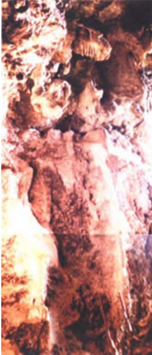
Figura 5. Interior de la "Cueva del Altar". Vista hacia arriba y hacia la abertura (Marzo de 1999)