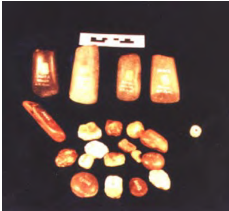
Figura 2. Objetos de piedra encontrados por L.H. Ayme en la "Cueva del Altar", en 1885.

Todos los objetos que reunió Ayme y las circunstancias en que ello ocurrió, ayudan a echar luz sobre aspectos del pasado que pueden alentar una continuidad en los estudios y la cooperación, tanto ahora como en el futuro. Esto es así sobre todo en el caso de Santa María. Parte de mi tiempo se ha ido acercando a los habitantes de Santa María información sobre su patrimonio, a través de fotografías, mapas, reconocimientos y entrevistas, y ha sido una dimensión muy gratificante de mi experiencia en esta investigación.