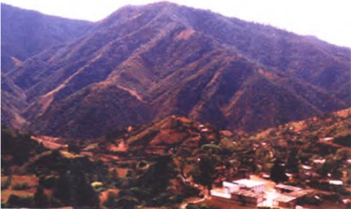
Figura 1. Vista de Santa María Coatlan desde el sendero de entrada (Enero 1998)