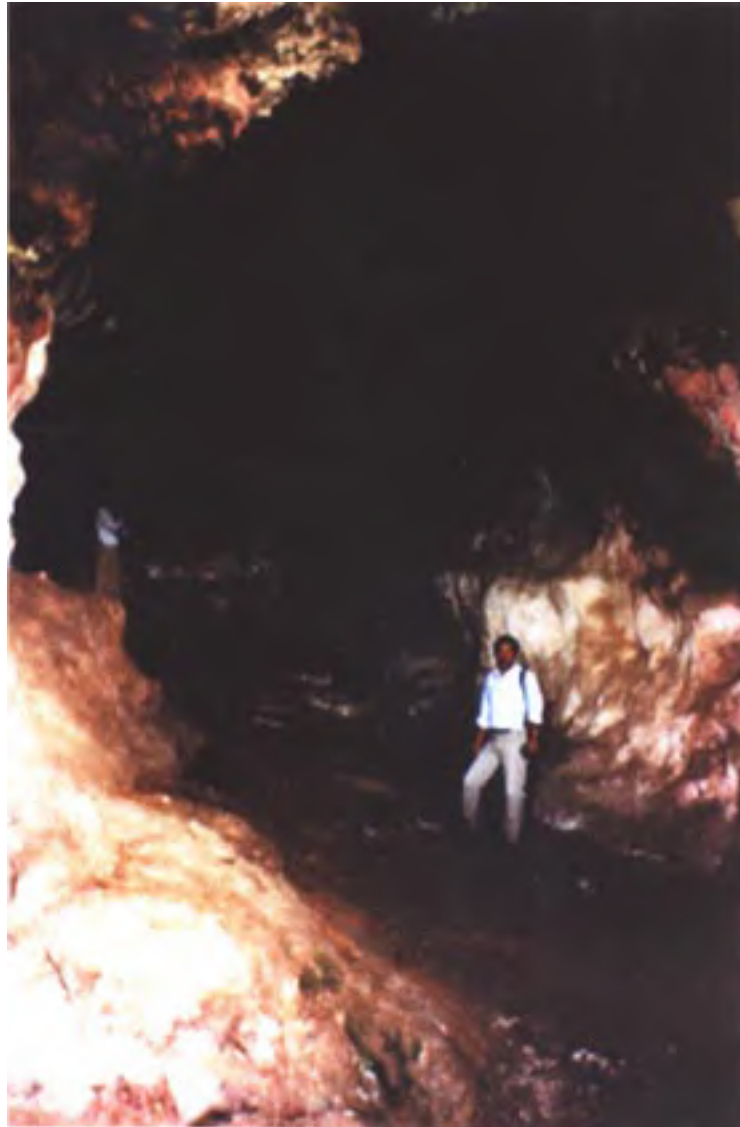
Figura 12. Interior de la "Cueva del Altar". Vista hacia el interior y el fondo de la cueva (Julio de 2002)

En este viaje de regreso uno de mis objetivos era poder continuar con mis investigaciones, algunas de las cuales no podían efectuarse desde los Estados Unidos, para seguir trabajando en Cuilapan con la cerámica oaxaqueña y visitar otras áreas donde Ayme había recolectado objetos; afortunadamente pude avanzar con algunos de estos proyectos.