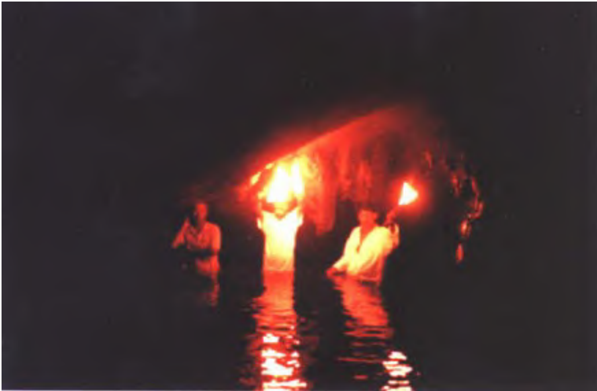
Figura 7. Interior de la Cueva de Agua (Marzo de 1999)